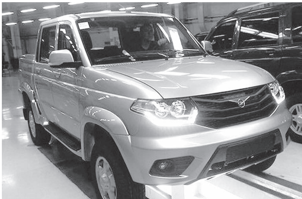
Тем временем в Интернете появились фотографии обновленного Patriot, который должен сойти с конвейера 1 октября

Программа утилизации УАЗа предполагает аналогичные условия. Она также действует на весь модельный ряд и также до конца года. Ульяновский автозавод принимает на утилизацию бывшие в употреблении автомобили любого