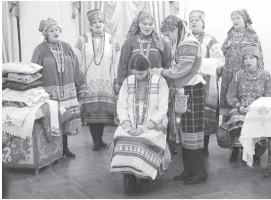
Справка «Ульяновской правды»